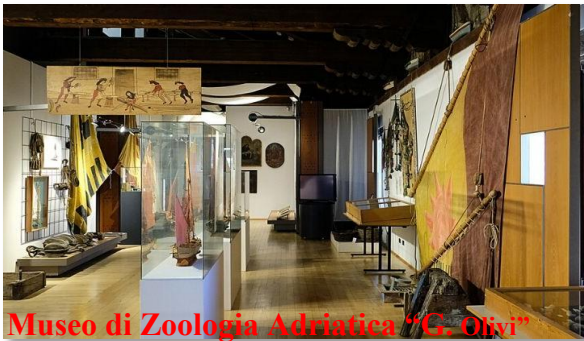
Museo di Zoologia Adriatica "G. Olivi"