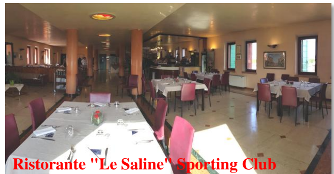
Ristorante "Le Saline" Sporting Club