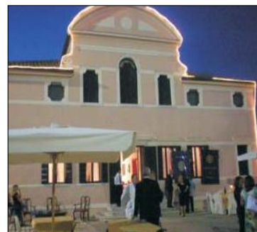
Villa Cà Tiepolo ad Albarella

Ritrovo alle ore 19,00 presso il parcheggio situato di fronte alla Chiesa della Navicella in località Ridotto Madonna. Si prega di dare l'adesione al Prefetto entro il 15 di agosto.