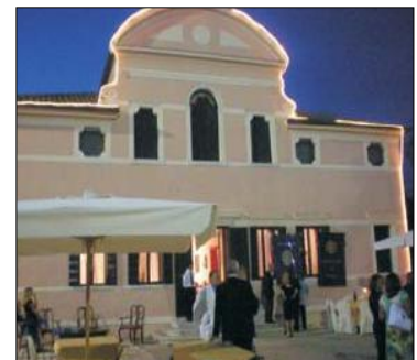
Villa Cà Tiepolo ad Albarella

Si prega di dare l'adesione al Prefetto entro il 15 di agosto.